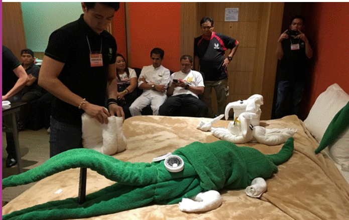
Doblando Toallas - Concurso en la Olimpiada de Camareras de Piso de Hoteles en Manila, Filipinas

En Camboya, el Sindicato de Apoyo a los Derechos Laborales de Empleados de Khmer en el Hotel Naga (NHW) pudo negociar con la gerencia el aumento de 1 a 2 créditos a las camareras de piso por limpiar una habitación en suite y negociar un incentivo para las camareras que limpien más de 14 habitaciones. El sindicato también negoció mejores disposiciones para las camareras de piso que se sientan mal durante sus horas de trabajo.