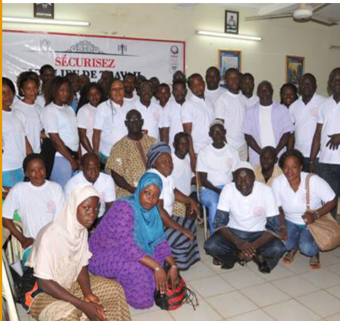
Trabajadores y trabajadoras en una conferencia en Burkina Faso realizan una campaña en favor de la ratificación nacional del Convenio 172 de la OIT relativo a las Condiciones de Trabajo en Hoteles y Restaurantes.

En Sudáfrica, nuestra campaña brindó un marco de referencia para resistir el trabajo precario. En reuniones a la hora del almuerzo con camareras de piso en todo el país, SACCAWU organizó a las trabajadoras/es para exigir puestos de trabajo seguros y de tiempo completo. En la cadena hotelera Protea, se llevan a cabo negociaciones para obtener la licencia por maternidad y protecciones contra el acoso sexual.